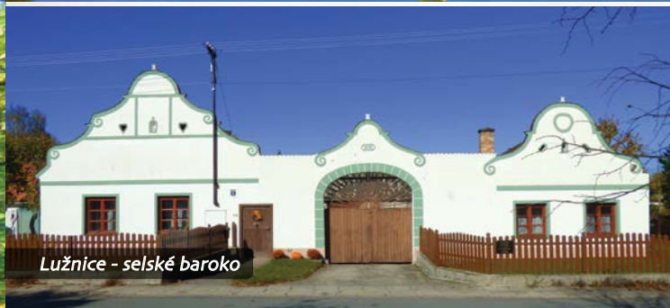
Lužnice - selské baroko

Rybník Dvořiště Jeden z nejstarších jihočeských rybníků založený ve 14. století, rozšířený Jakubem Krčínem v r. 1582.