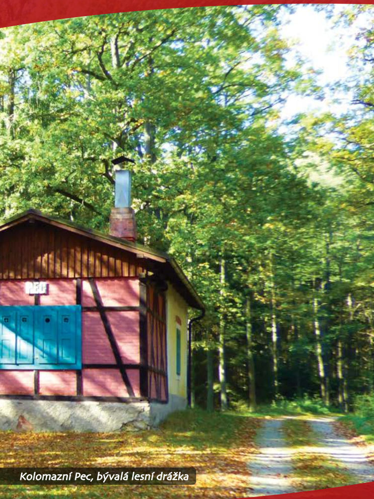
Kolomazná Pec, bývalá lesní drážka

Lomnice nad Lužnicí restaurace Eden, tel. 384 792 331 Stará Hlína Rožmberská hospůdka tel. 774 903 023 Třeboň Pergola u sv. Víta