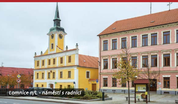
Lomnice n/L - náměstí s radnicí

Trasa A: 47 km (Třeboň – Slověnice – Smržov – Lomnice nad Lužnicí – Stará Hlína – Třeboň) Trasa B: 57 km (Třeboň – Slověnice – Mazelov – Lomnice nad Lužnicí – Stará Hlína – Třeboň) Trasa C: 68 km (Třeboň – Slověnice – Mazelov - Bošilec – Lomnice nad Lužnicí – Stará Hlína – Třeboň)